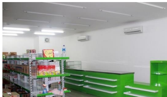
Gambar 7. Pembentukan SMK-Mart sebagai tempat penjualan atau stockist hasil karya siswa yang dijual secara offline dan online