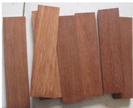
Gambar 3. Kayu Merbau

Berikut adalah contoh implementasi penerapan pembelajaran berbasis: PjBL, SBE, dan School to work pada pemberdayaan kayu merbau Papua menjadi pot kayu dan aksesoris pahat: