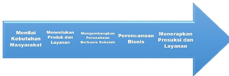
Gambar 1 Konsep Implementasi Model Pembelajaran School Based Enterprise

Penerapan model ini diharapkan dapat meningkatkan produktivitas karya siswa yang dapat dipasarkan dan keuntungan dapat digunakan untuk meningkatkan fasilitas pembelajaran. Berikut ini adalah konsep implementasi model pembelajaran