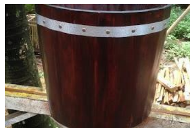
Gambar 6. Produk Pot Kayu