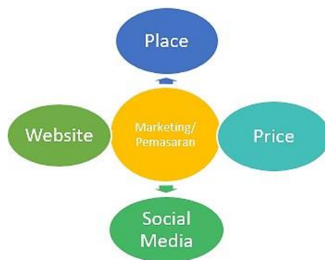
Gambar. 8 Strategi Marketing Produk