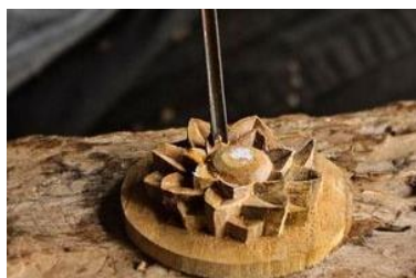
Gambar 5. Produk Aksesoris Pahat