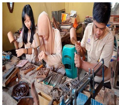
Gambar 4. Siswa Sedang Memproduksi Kerajinan Kayu